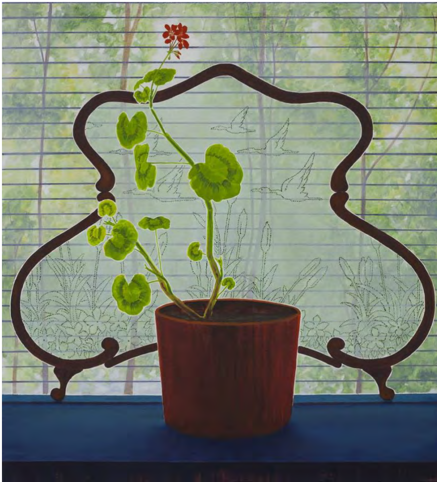
the island anthony , 2020, 60x66 cm, olie en acrylverf op doek