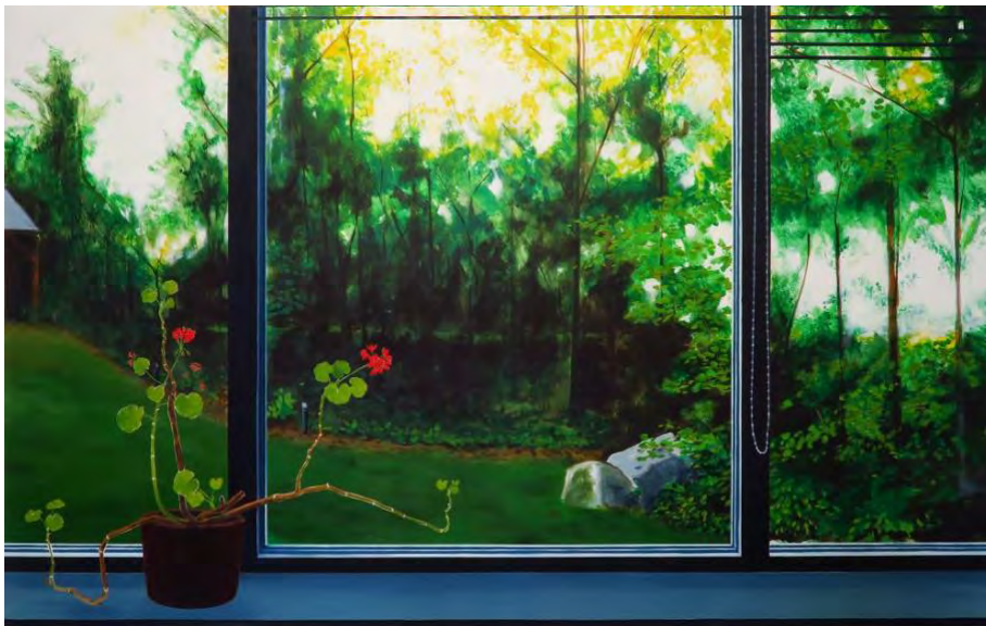
Suilen , 2020, 188x188 cm, acryl en olieverf op doek

De tentoonstelling heet Suilen , een verbastering van het Sesamstraat-liedje 'Schuilen' dat favoriet was bij het zoontje van de kunstenaar toen het jongetje zijn beentjes brak tijdens een vakantie in 2020. Het titelstuk van de tentoonstelling is het uitzicht vanuit dat vakantiehuisje: een grasveld, een bosje, een stukje schuur, allemaal gevat in een meedogenloos recht geschilderd kozijn. Het enige dat zich onttrekt aan zowel de rechtlijnigheid van het huis als het wollige vormgeving van de natuur buiten, is de geranium (pelargonium zonale) op de vensterbank wiens takken schijnbaar willekeurig alle kanten op groeien. De takken van de geranium staan iets af tegen de achtergrond, een effect dat verkregen is door de vormen uit te sparen in de direct omringende verf.