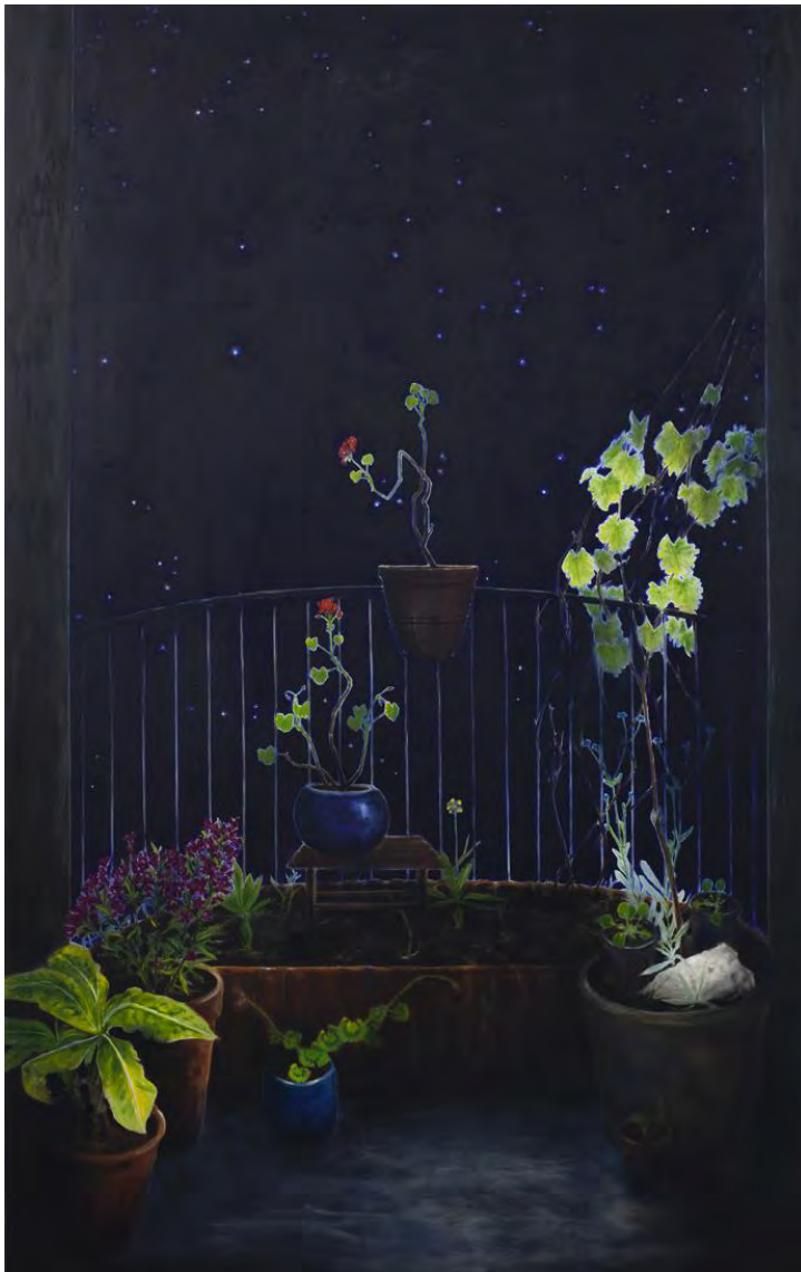
Bodo's balkon , 2020, 118x188 cm, olieverf op doek

In drie donkere schilderijen uit 2020, 'Banaan', 'Bodo's balkon' en 'Catonica' zien we verschillende planten, waaronder een bananenplant, een geranium en een pannenkoekplantje, afgebeeld tegen donkerblauwe sterrennachten. De sterren zinderen in de lucht en lijken te knipogen naar de beschouwer. Maar het is niet het schilderij dat beweegt: wij zijn het. Van Leeuwen heeft een manier van overschilderen gebruikt waarbij hij het witte centrum van de sterren heeft uitgespaard in de verf, om vervolgens de diepe kleuren van de lucht eromheen te schilderen. De nacht is opgebouwd uit blauw- en zwart-tinten en raakt bijna aan de planten op de voorgrond. Maar net niet helemaal, want als we van dichtbij gaan kijken, zien we hoe de planten een stralenkrans krijgen waar de nacht ze niet aanraakt. Niet onvergelijkbaar met de echte sterrenhemel creëert deze manier van werken een diepteverschil dat niet direct waarneembaar is, maar wel een zuigend effect heeft, waarbij je blik naar de lichtende puntjes wordt gebracht.