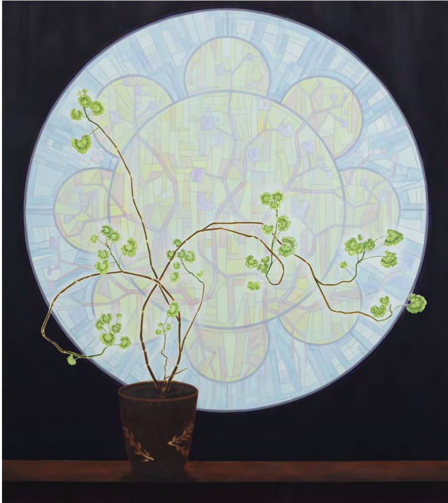
Rosace , 2020, 125 x 140 cm, olieverf op doek